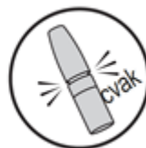
6. Nasad'te uzávěr

V případě, že sprej není vystřikován po celou dobu stlačení nebo pokud nebyl přípravek používán po dobu delší než 7 dní, musí být pumpička znovu naplněna 2 stlačeními. Dávejte pozor, abyste si sprej nevstříkli do očí nebo do úst.