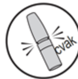
6. Nasad'te uzávěr

V případě, že sprej není vystřikován po celou dobu stlačení nebo pokud nebyl přípravek používán po dobu delší než 7 dní, musí být pumpička znovu naplněna 2 stlačeními. Dávejte pozor, abyste sprej nevstříkli dítěti do očí nebo do úst.