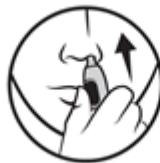
3. Vložte do nosu