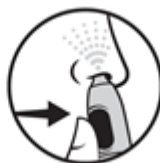
4. Stiskněte tlačítko