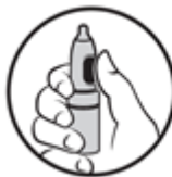
2. Palec na tlačítko