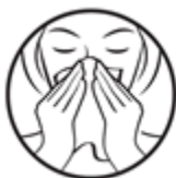
1. Vyprázdňte nos