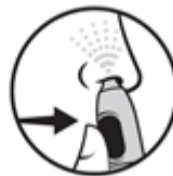
4. Stiskněte tlačítko