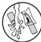
5. Očistěte a osušte