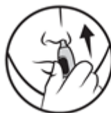
3. Vložte do nosu